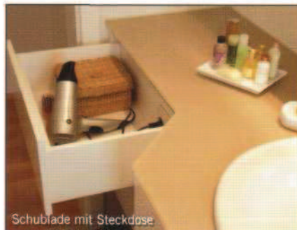
Schublade mit Steckdose