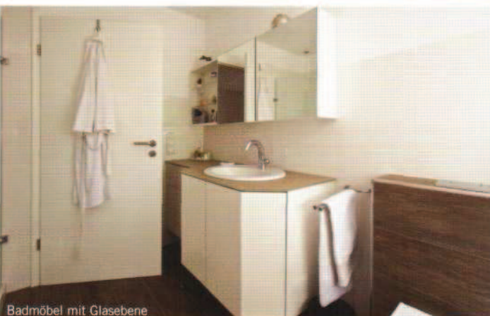
Badmöbel mit Glasebene