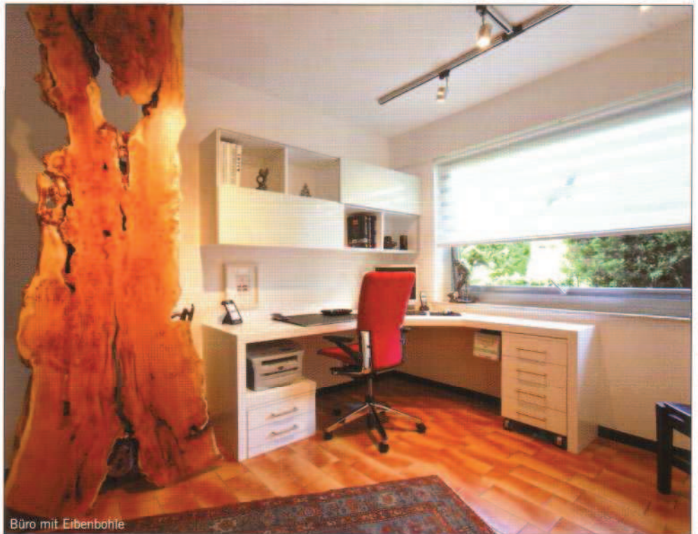
Büro mit Eibenbohle